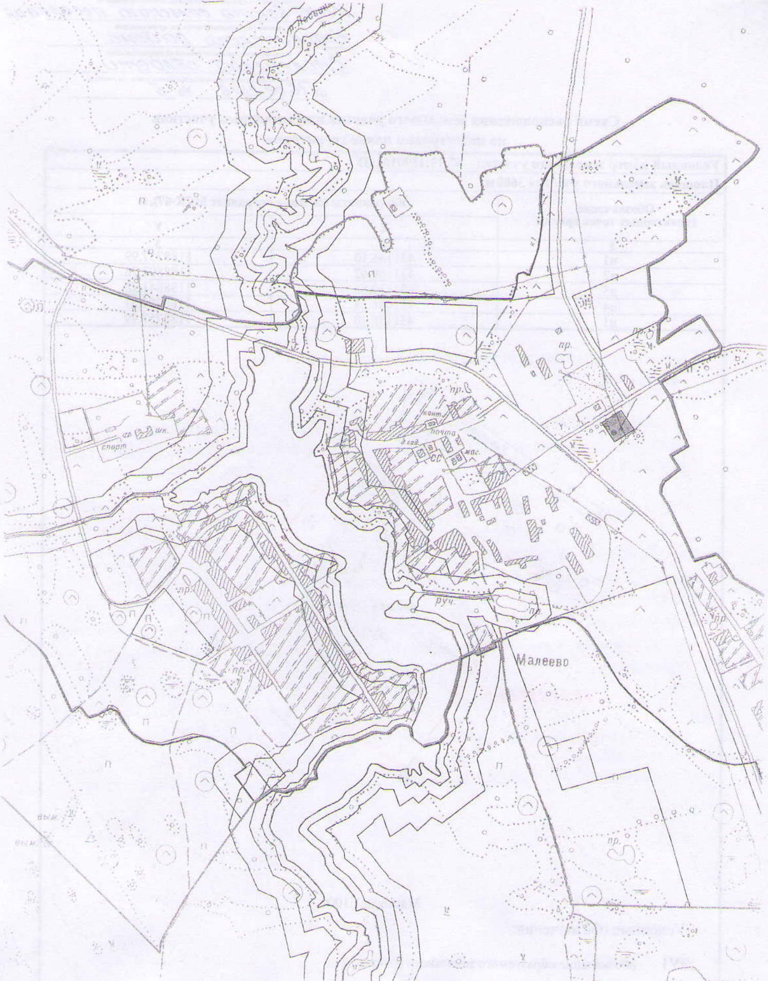
Схема расположения земельного участка