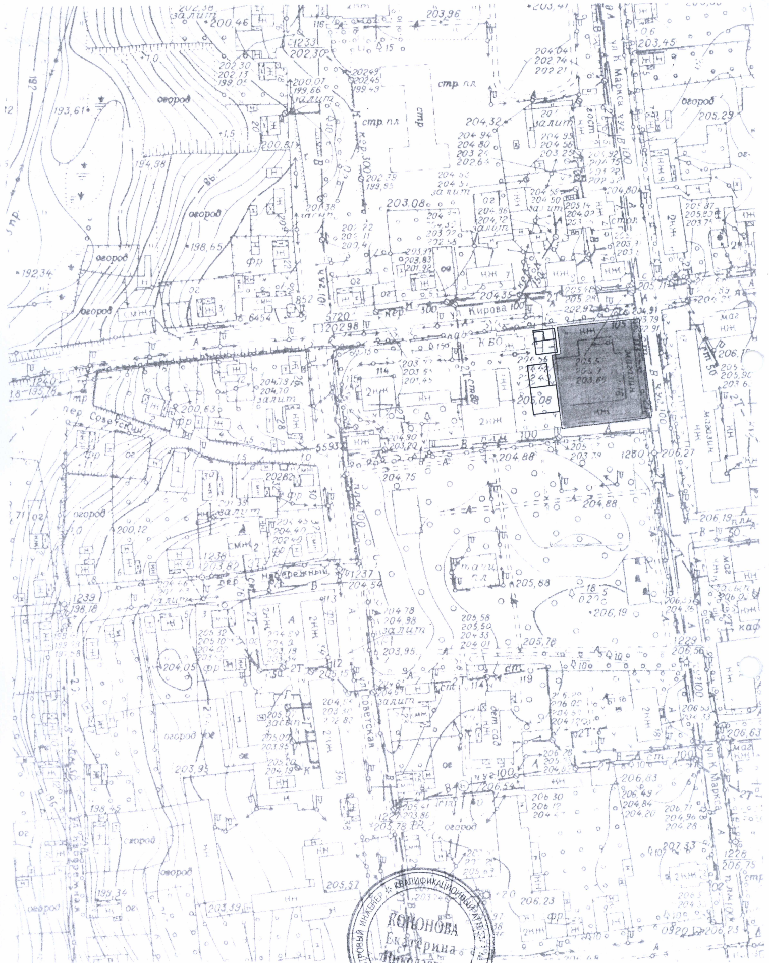
Схема расположения земельного участка