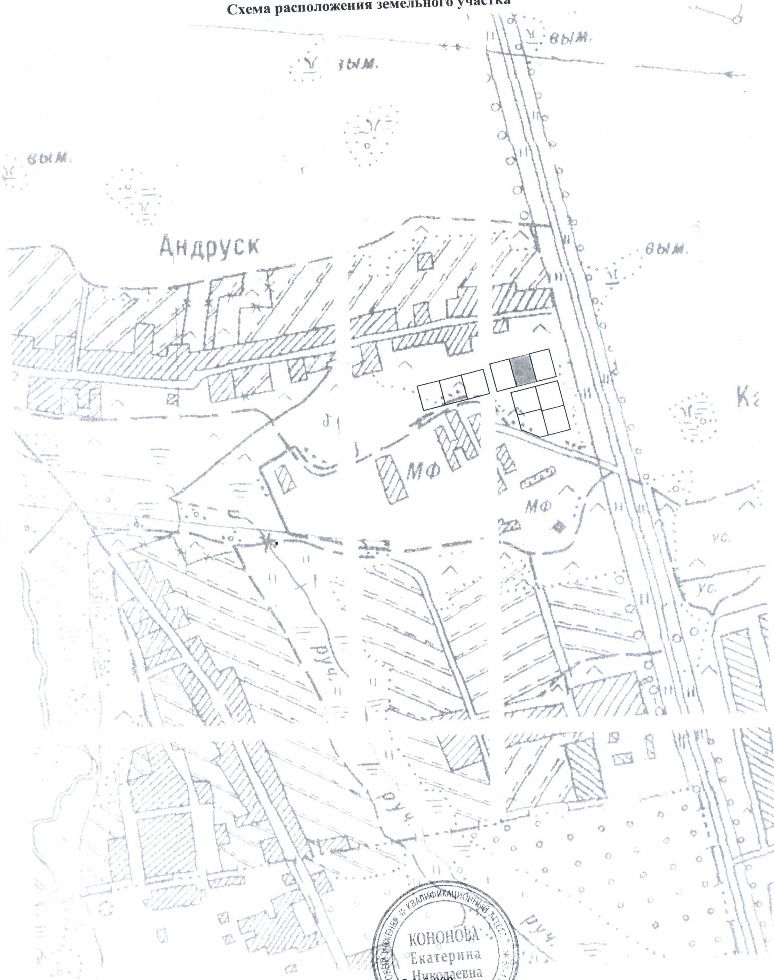
Схема расположения земельного участка