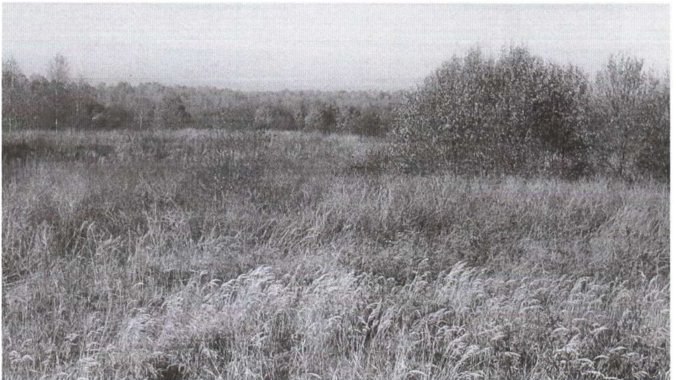
Фото №2 (дата 05.10.2018)