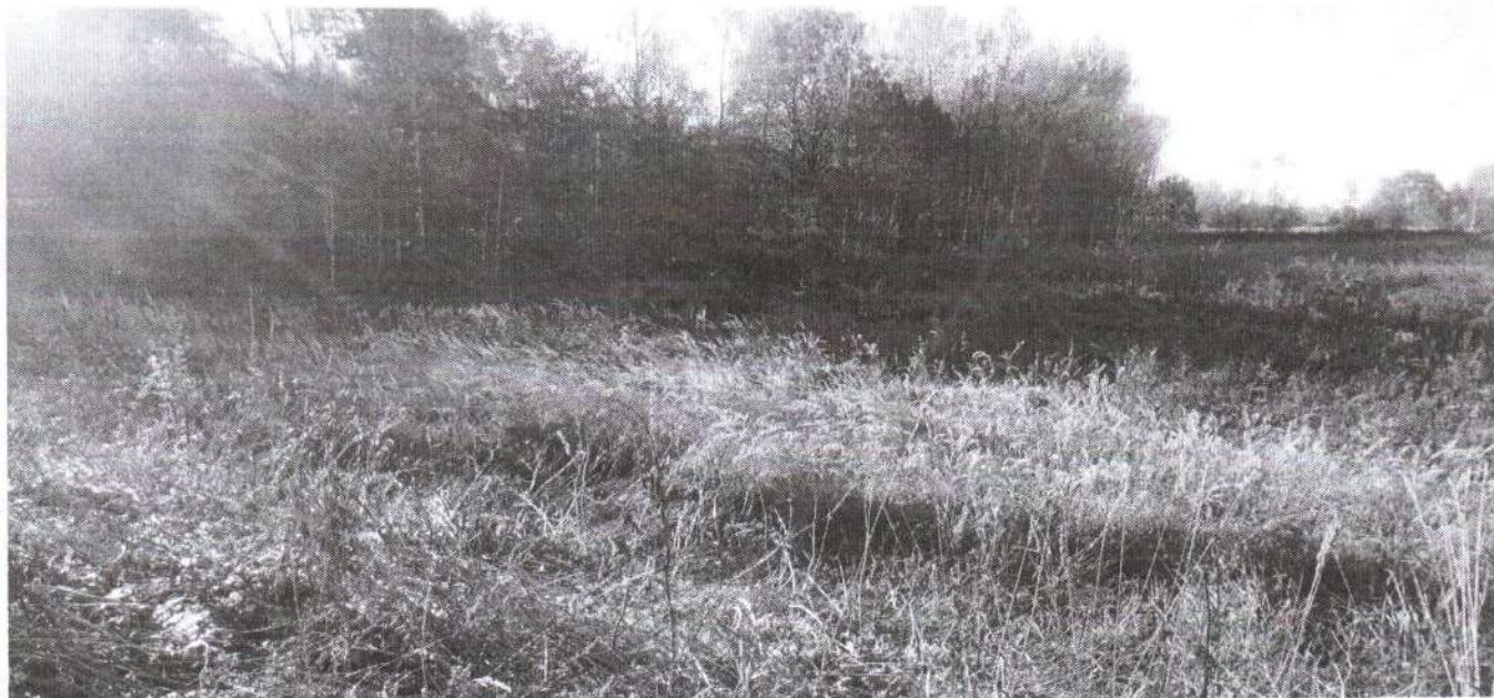
Фото №3 (дата 05.10.2018)