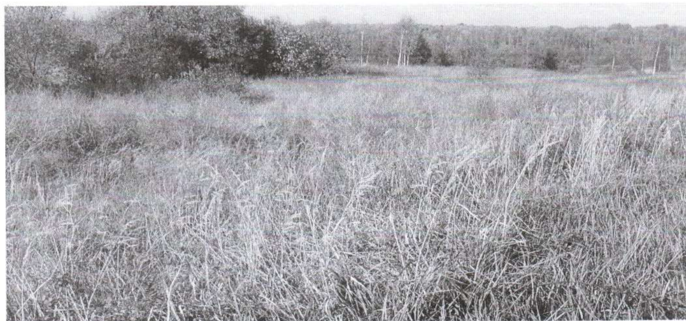
Фото №4 (дата 05.10.2018)

зам.Главы МО «Краснинский район» Смоленской области