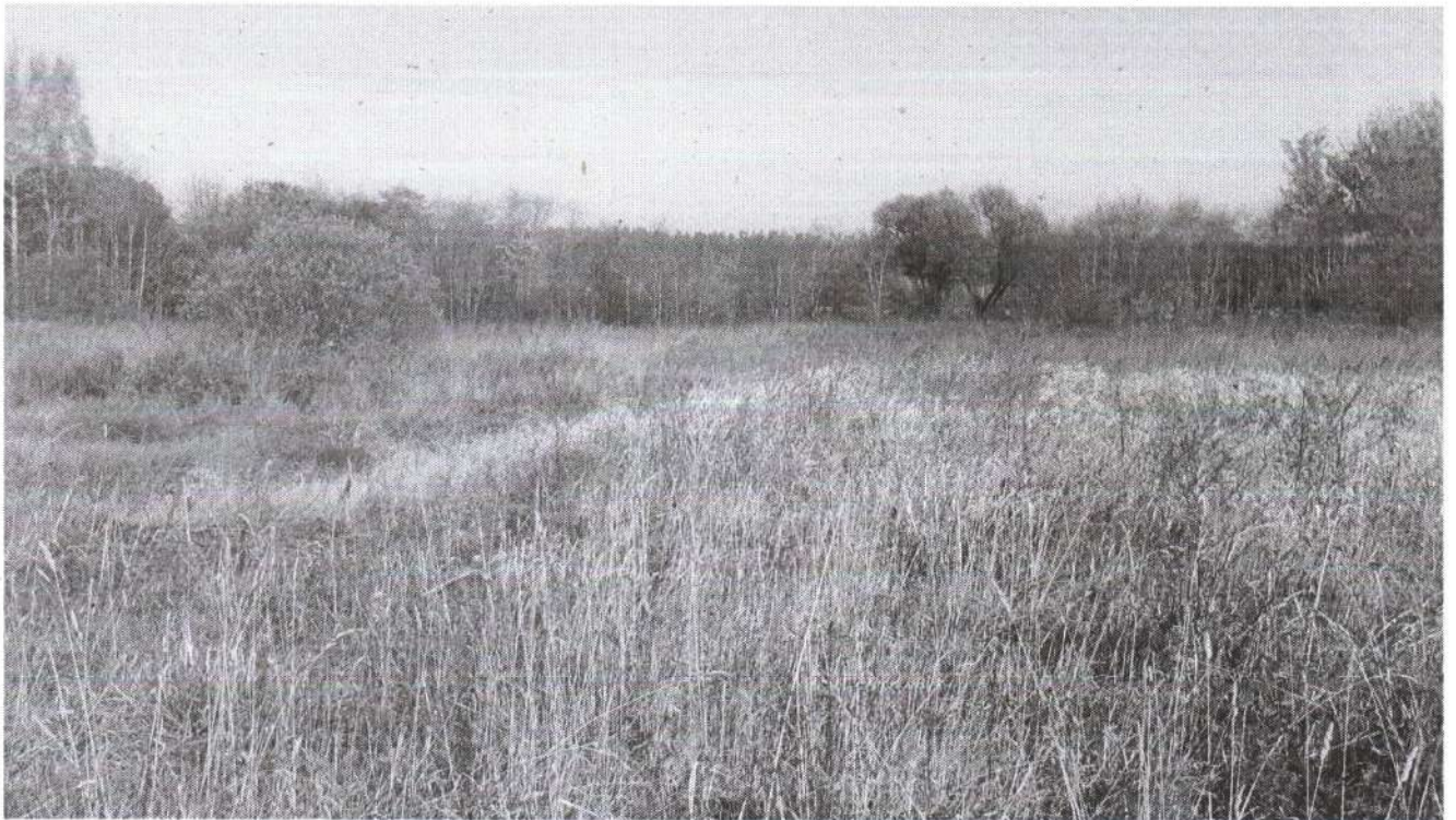
Фото №1(дата 05.10.2018)

(приложение к акту осмотра земельного участка с кадастровым номером 67:11:0030101:289 от «05» октября 2018г.)