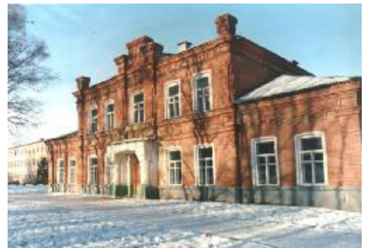
Здание Земской школы, кон. XIX в.

Здесь начинали свою артистическую деятельность краснинцы, ставшие знаменитыми: народный артист, лауреат Государственной премии В.С. Нельский, оперная певица А.А. Халилеева.