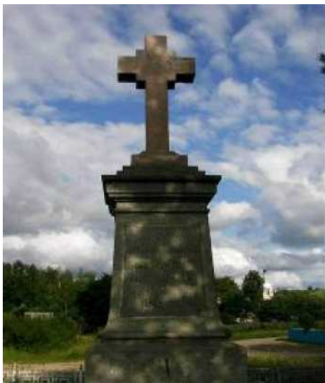
Могила воинов, погибших в боях 1812