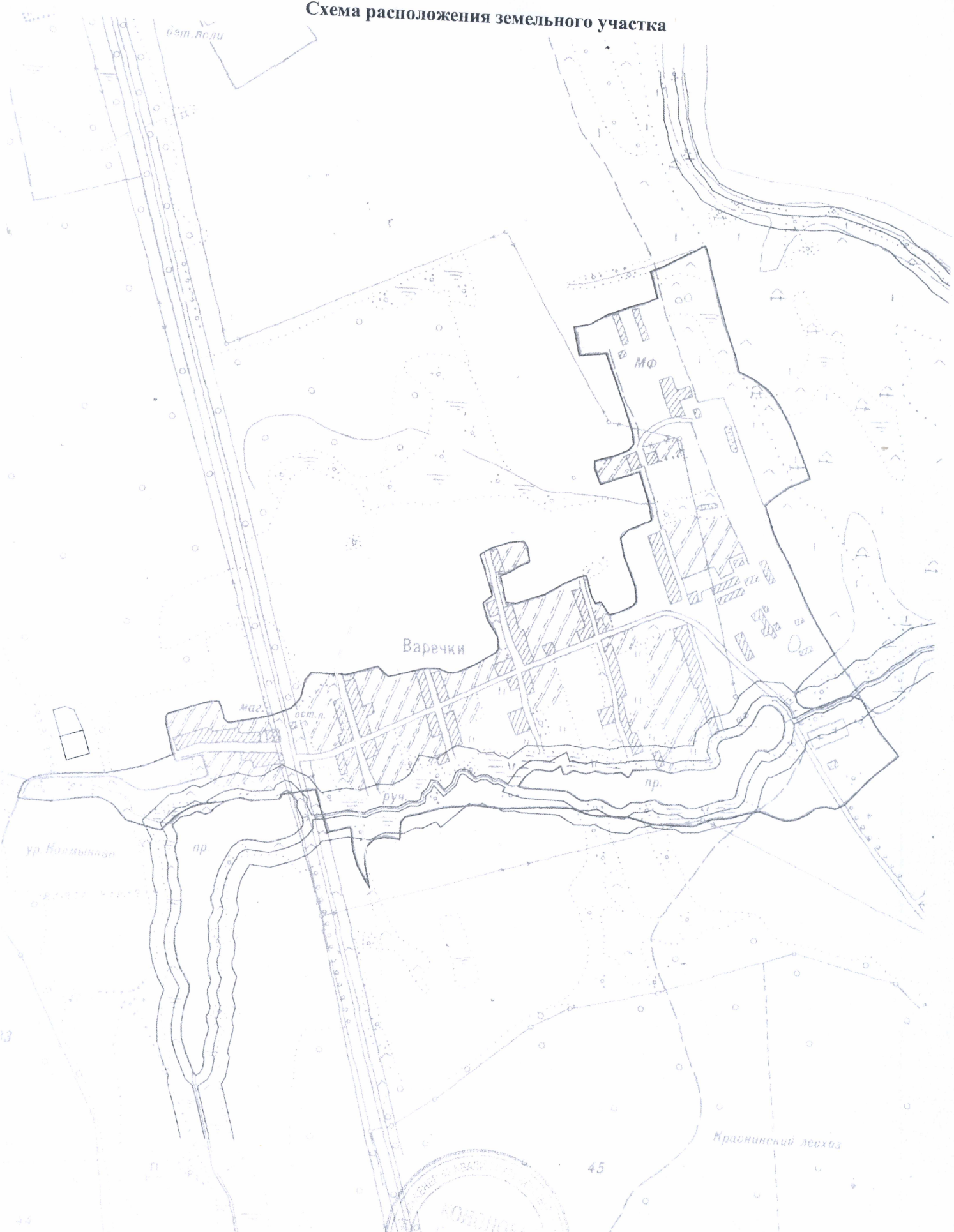
Схема расположения земельного участка